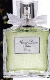
Miss Dior Cherie L'eau, Dior.