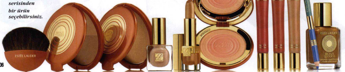
Estee Lauder Bronze Goddess serisinden bir ürün seçebilirsiniz.