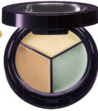
Oriflame Beauty kapatıcı kit, 11.90 TL.