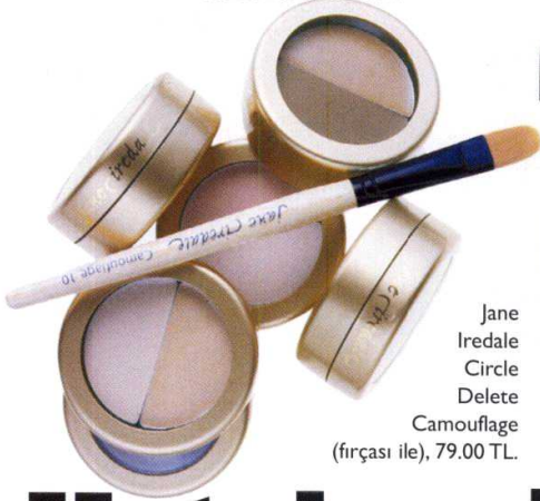
Jane Iredale Circle Delete Camouflage (fırçası ile), 79.00 TL.

Hazırlayan: Güzide YÜLEK HÜYÜK gyulek@doganburda.com