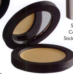
Shiseido Concealer Stick, 62.00 TL.