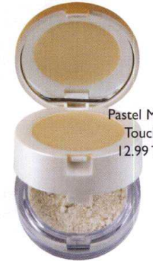
Pastel Magic Touch, 12.99 TL.