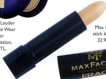
Max Factor stick kapatıcı, 32.90 TL.