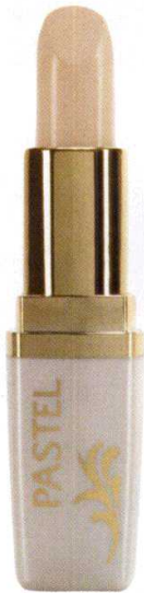
Pastel Coverstick, 8.99 TL.