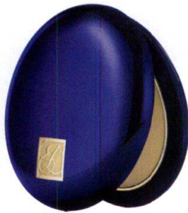
Estée Lauder Double Wear Powder Foundation, 88.00 TL.