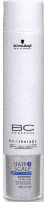
Bonacure derin temizleme şampuanı: 39 TL. SCHWARZKOPF

ormonal dengesizlikler, stres, kullanılan bazı ilaçlar, kalıtsal durum gibi birçok etken saçların yağlanmasına neden oluyor. BC Derin Temizleme Şampuanı işte bu noktada imdadımıza yetişiyor. Eğer sizin de saçlarınız yıkandıktan itibaren yağlanmaya başlıyor, bunun sonucunda da saç şekliniz bozuluyor ve saçlarınız istenmeyen bir parlaklıkla cansız görünüyorsa bu ürün tam size göre!