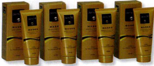
Dermokil cilt bakım maskelerinin fiyatları 22 ile 27 TL arasında değişiyor. DERMOKİL

Kil Dermokil'in cilt bakım maskelerinde yeniden hayat buluyor. Zengin vitamin ve minerallerle harmanlanan kil bazlı bu cilt bakım maskeleri, deride bakteri gelişimini engelliyor, cildi ölü hücrelerden arındırıyor, cilt lekelerini gideriyor, gözeneklerde biriken yağı ve kiri arındırıyor, cildi temizleyerek sivilceleri kurutuyor. İçeriğinde bulunan emme özelliği sayesinde toksik maddelerin ciltten atılmasını da sağlıyor. Dermokil cilt bakım maskeleri; kuru, yağlı, akneli ve normal olmak üzere dört farklı cilt tipine göre ayrı ayrı satışa sunuluyor.